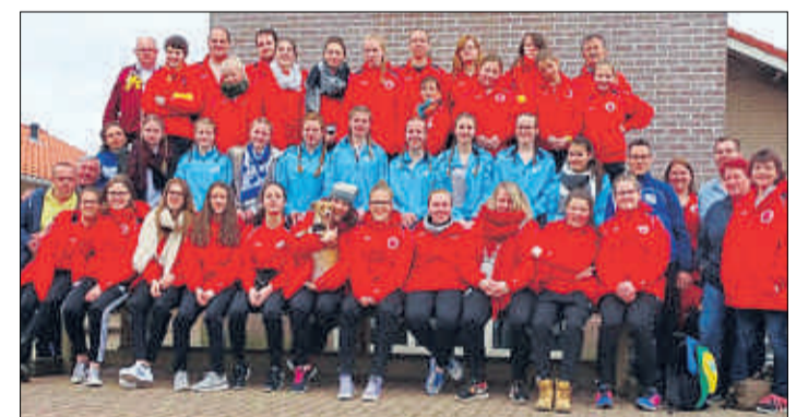
Auf Ameland trainierten die Fußball-Mädchen vom SSV Süng (blaue Jacken) gemeinsam mit Rot-Gelb Wesseling.

Als Ausgleich zum Sport gab es ein Fußball-Quiz und die Sportlerinnen erkundeten die Insel und den Leuchtturm mit seinen 236 Stufen. (tim)